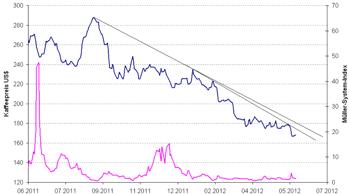
Abbildung 1: Kaffeepreis und MSI-Handelssystem

In der letzten Woche wurde Kaffee als Testbeispiel für das MSI-Handelssystem herangezogen. Da der Kaffeepreis Ende letzter Woche nochmals fiel, möchte ich daher ein kleines Update für diesen Markt geben.