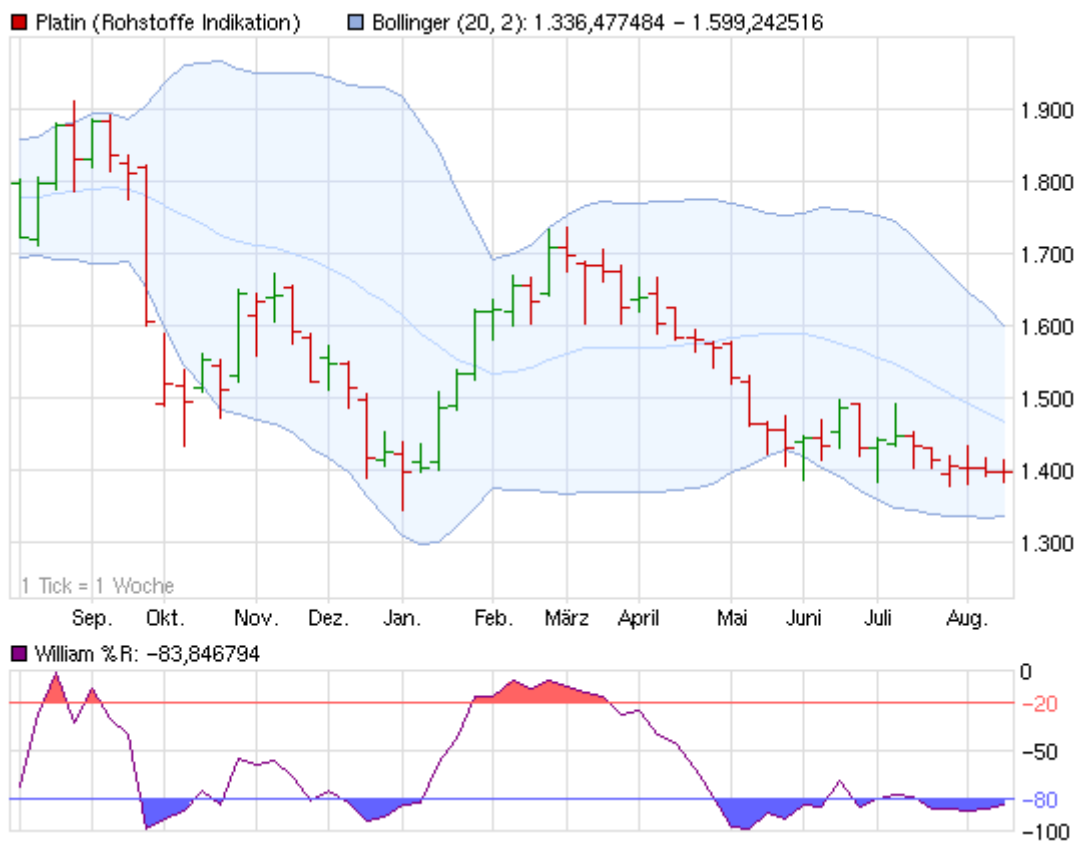
Abbildung 2: Platinpreis (Wochenkerzen) Sept. 2011 – heute